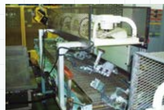
■冷却送風機付コンベア