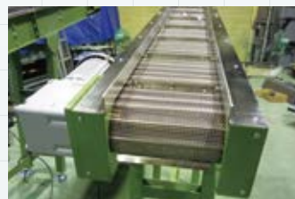
■オーダーメイド寸法にて製作