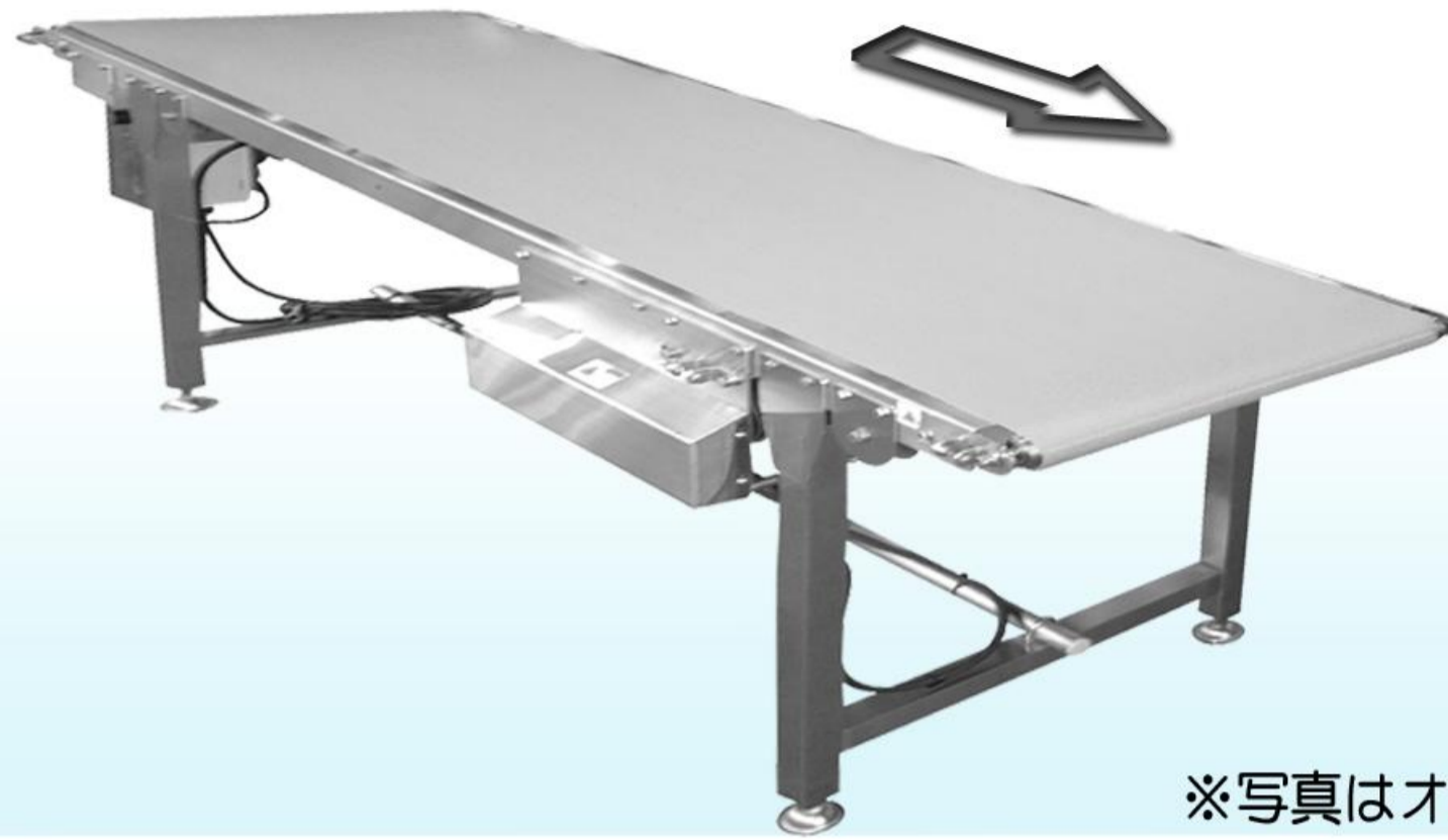
※写真はオプション付です。